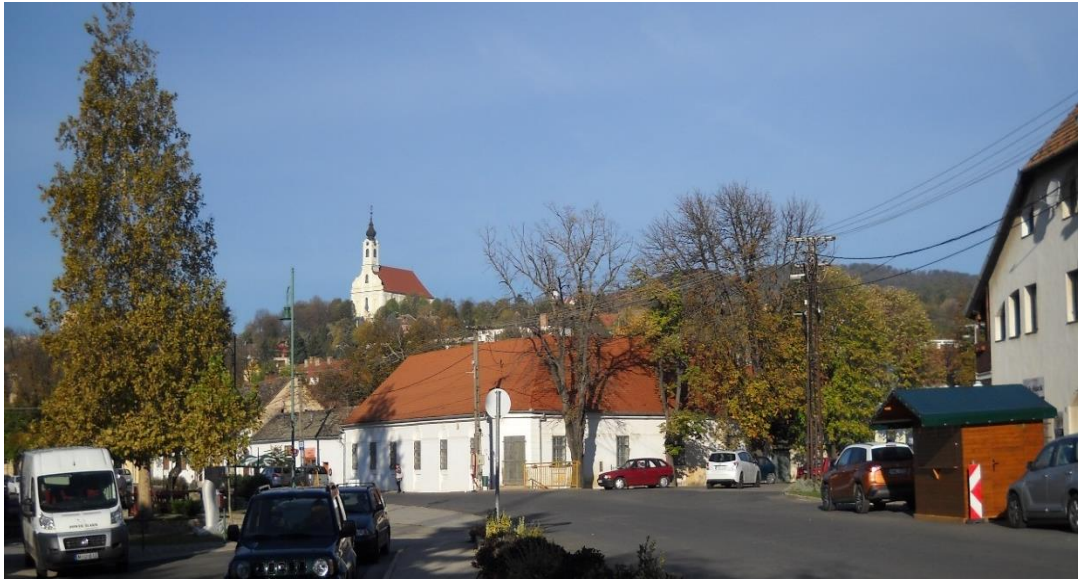
A volt Nékám-patika épülete felújított tetővel várja az alapok víztelenítését és kulturális szerepének betöltését.